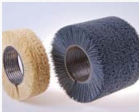
Spirálový kartáč z vlákniny (vlevo) a abrazivního vlákna (vpravo)