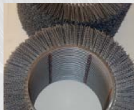
Spirálový kartáč - vnitřně svažený segment

Materiál se volí podle použití kartáče a lze všeobecně říci, že je možné použít jakýkoliv kartáčnický osazovací materiál. Zaměříme-li se na použití v ocelářském průmyslu a především na výrobu tenkých plechů z oceli a barevných kovů válcovaných za studena, budou nás zajímat jen některé druhy osazovacích materiálů. Jestliže je válcový kartáč určen pro práci do odmašťovací linky, to znamená, že pouze pomáhá mechanicky odstraňovat z povrchu pásu plechu masť a nečistoty, pak poslouží jako osazovací materiál vlákna z polypropylenu nebo polyamidu. Vlákna bývají většinou uzavřena v nerezové pásce.