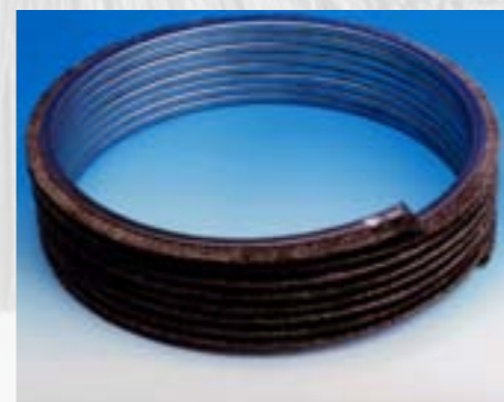
Spirálový kartáč - volná spirála