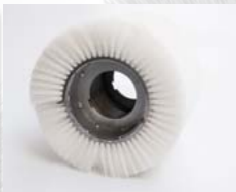
Spirálový kartáč z PPN s víčkem

Válcové spirálové kartáče jsou definovány těmito rozměry: