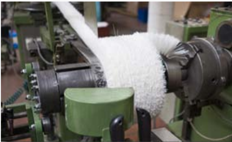
Navíjení spirálového kartáče - jednotlivý segment