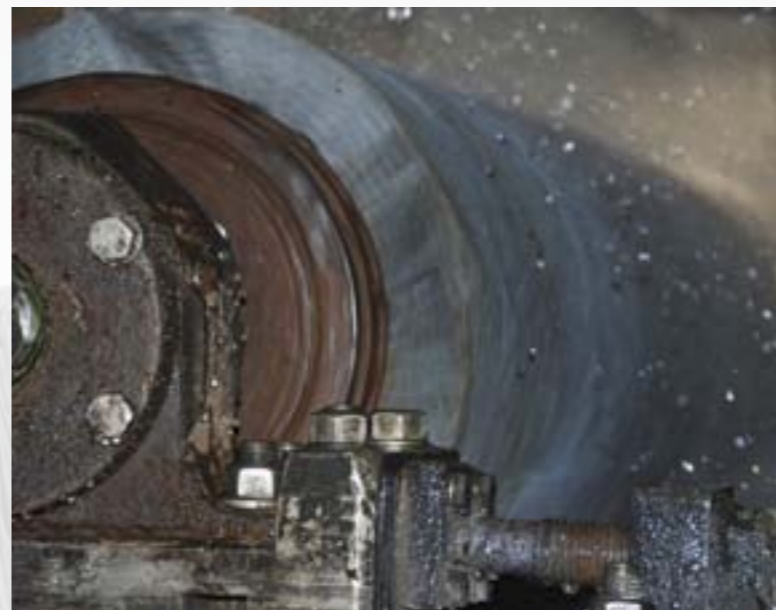
Spirálový kartáč v provozu