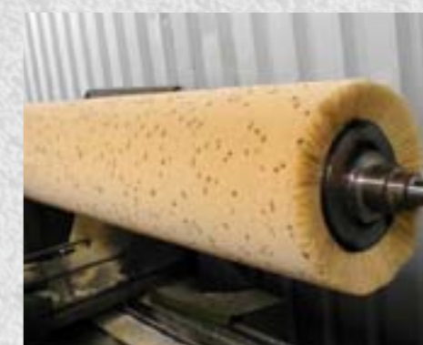
Spirálový kartáč navinutý na hřídel