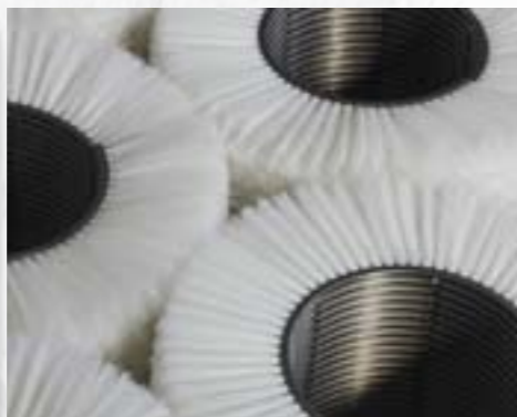
Spirálový kartáč z PPN